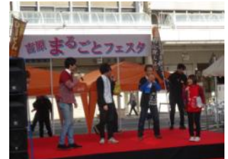
吉原まるごとフェスタ。B1グラウンドに出場する地元「つけナポリタン」を始め、近県から数グループが集まった。近い将来、本大会誘致も計画。