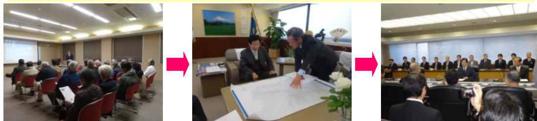
(写真左から右へ順に、地区県政報告会、知事と市議会議員長、知事への会派次年度予算折衝)

毎年、12月後半に自民改革会議から知事に次年度予算折衝が行われる。県政全般に渡り、施策として具体的な申し入れを行うもので、2月までの間数回に渡り、会派全員で、または政務調査会正副会長が当局と調整を行う。2月議会の予算審議前までに予算概要が提示され、申し入れの成果が確認できる。予算折衝前には、各市町からの要望を聞く機会もあり、今回は富士市議会が議決した案件を知事に直接要望する機会も得た。各議員は県政報告会等で直接意見を収集する。