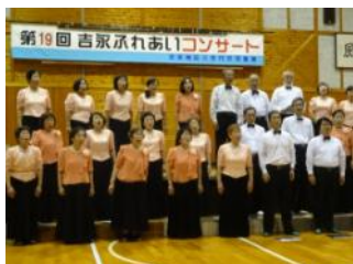
富士市吉永地区三世交代事業「ふれあいコンサート」は19回目。年齢性別にとらわれず、日頃の練習成果を披露。