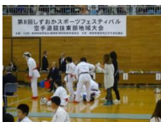
しずおかスポーツフェスティバル空手競技大会が開催。特に、少年少女の取り組みには大人も顔負け。2020年東京オリンピックなどが刺激に。