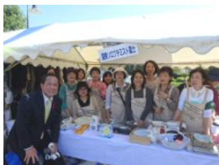
「富士市福祉まつり」において毎年バザーを開催する女性グループ。多くの市民が支える。