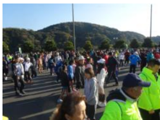
富士市のふじかわキウイマラソン。全国から3,000名の参加者が訪れる。天候に恵まれ、富士川沿いを快走した。