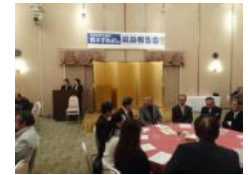
富士市全体対象の県政報告会